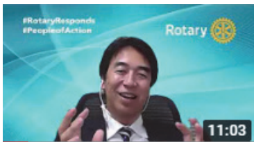
クラブ国際奉仕プロジェクトの懸け橋となる米山学友