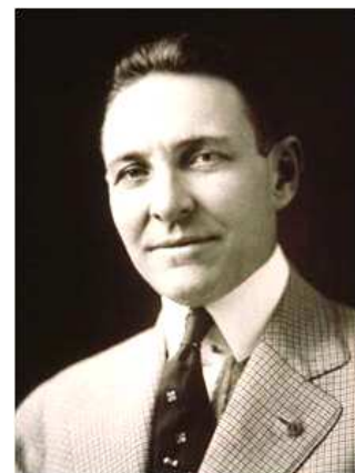
ロータリー財団の創設者アーチ C. クランプ

アーチ・C・クランプが演説をした「世界でよいことをしよう」がロータリー財団の標語となっています。