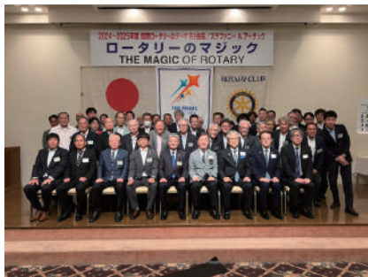
7月18日 浜松南RC グランドホテル浜松