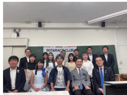
7月23日 甲府南RAC 山梨大学