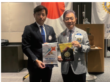
7月24日 富士RC グランドホテル富士