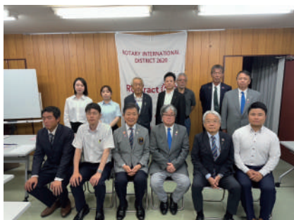
7月25日 島田RAC 島田自家用自動車協会

そして、地区内に5つあるRACのうちの3クラブを訪問させていただきましたが、提唱クラブとの活動やコラボレーションはもちろんあると思いますが、地区といたしましても奉仕を共にする仲間として、若い皆さんのアイデアを取り入れた活動が展開できたらお互いの刺激になるのではないかと思います。