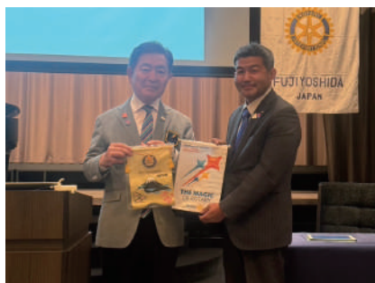
7月24日 富士吉田RC ホテル鐘山苑